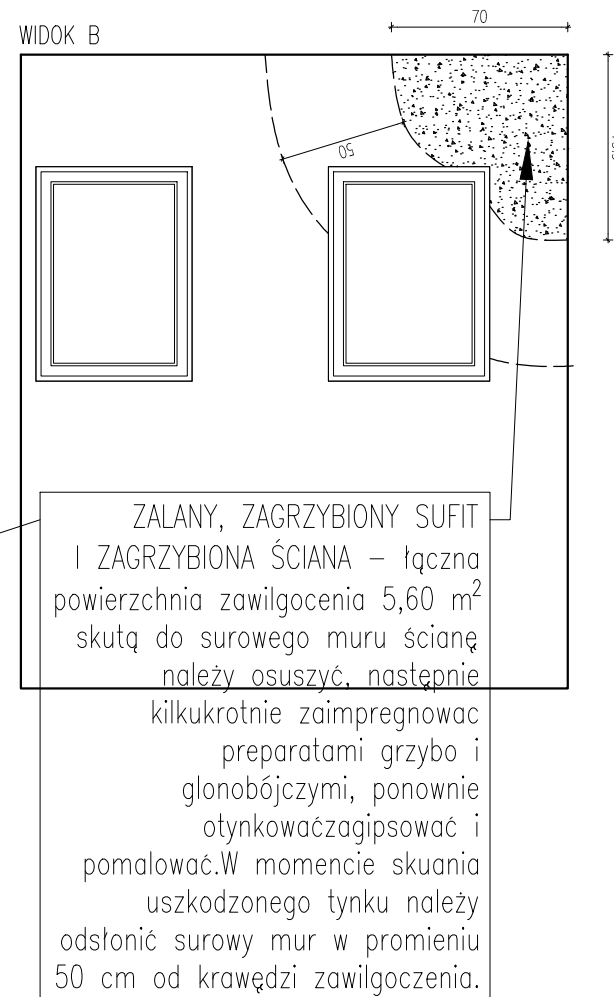
WIDOK ŚCIANY "B" - SKALA 1:30